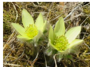
ツクモグサ(5月下旬～6月下旬)